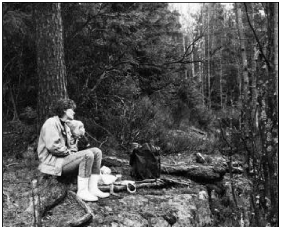
Skogturen kan gi rike naturopplevelser, økt familiesamhold og trivsel.

ulike konsekvenser for ulike typer av friluftslivsutøvere.